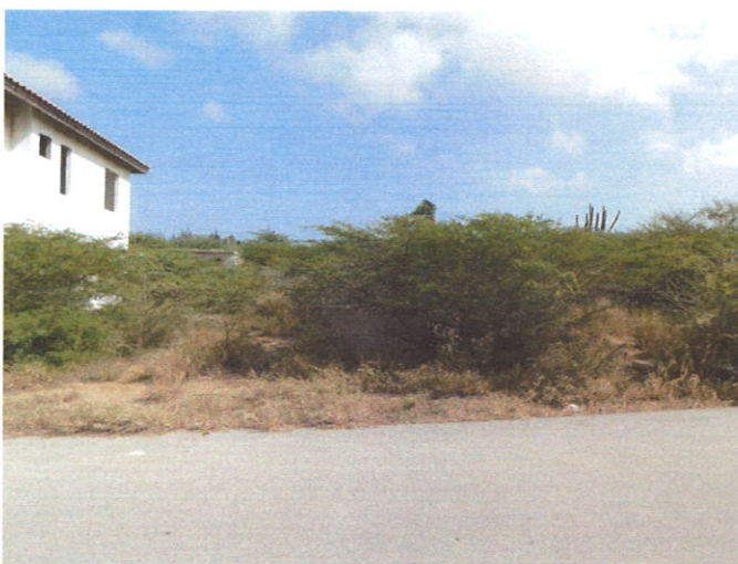
Aanzicht, eigendomsgrond @ Sero Preto Zn.