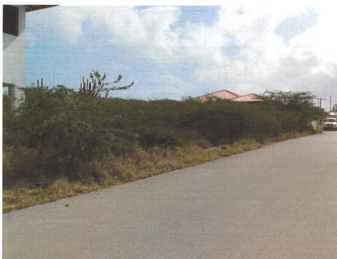
Aanzicht, eigendomsgrond @ Sero Preto Zn.