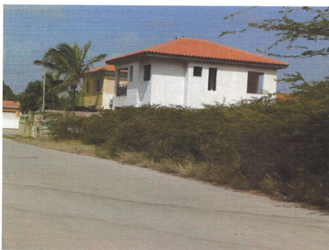
Aanzicht, eigendomsgrond @ Sero Preto Zn.